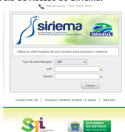
Figura 3 - Visualização da Tela de Acesso ao Siriema.

O primeiro passo para a solicitação de Outorga é efetuar a(s) declaração(ões) de uso(s) no Cadastro Estadual de Usuários de Recursos Hídricos – CEURH, no Sistema Imasul de Registro e Informações Estratégicas de Meio Ambiente - Siriema, disponível em http://siriema.imasul.ms.gov.br . A figura 3 mostra a tela de acesso ao respectivo sistema.